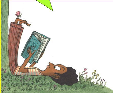
Immagine tratta da: "101 posizioni per leggere passionatamente", Timothée de Fombelle